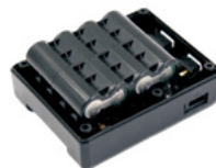
更安全、更紧凑的结构设计