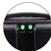
电池放电/充电工作指示灯